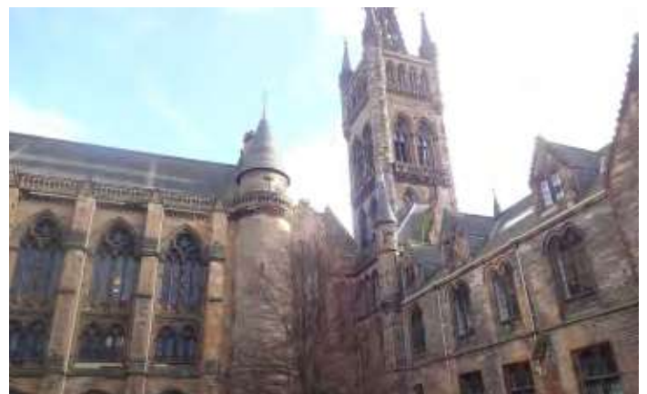
グラスゴー大学：ハリポットの撮影でも使われたキャンパス

ているとも言えるでしょう。グローバル化とは、多種多様な価値観が渦巻くこの世界で、自分自身が「相対化」される、すなわち自分の価値観はthe only one なのではなく、one of themであることを知るということです。そして、そのまっさらな状態から自分自身はどのように考え何を選択しよう生きていくのか、そのnever-ending taskに関わっていくということです。皆さんも、日本国内外様々なところでたくさんの人やものと出会い、たくさん「大きく」なったり「軽く」なったりしてください。私もそのお手伝いができればと思っています。